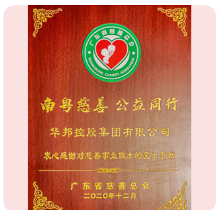
华邦获评广东“2020 年慈善公益企业”称号

【本 报 讯】2020 年 12 月 16 日，2020 “南粤慈善 公益同行”活动在广州举