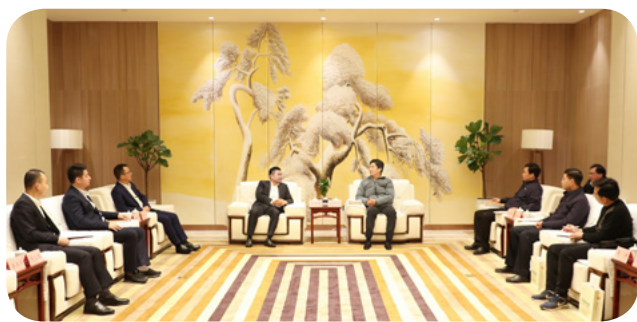
白松涛(中间右)与苏如春交流,希望华邦积极参与到玉林的高质量发展中来

【本报讯】2021年1月10日,广西壮族自治区玉林市委副书记、市长白松涛会见华邦控股集团董事局主席苏如春一行。双方就华邦参与玉林市基础设施、养老、保险