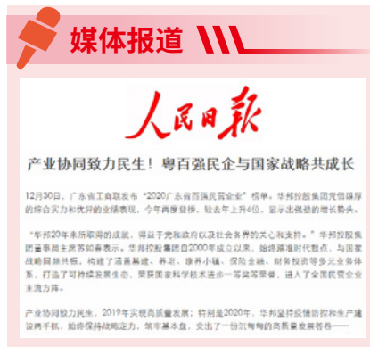
《人民日报》报道截图

广东省百强民营企业榜单自 2010 年发起以来，已连续发布十届，成为衡量广东民营企业影响力、规模及综合实力的权威参照。此次华邦再度荣登广东省百强民营企业榜单，标志着企业综合实力和经营业绩获得充分肯定和高度认可。