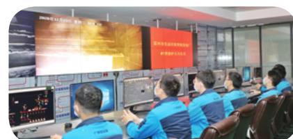
雷州发电厂 #1 锅炉点火瞬间

【本报讯】(华邦建投集团 鹿起其)2020年12月23日,由华邦建投集团承建的雷州市生活垃圾焚烧发电厂项目迎来关键性的一步,在广东湛江市环保局督察组、雷州市城综局及各参建单位负责人的见证下,#1 锅炉点火试烧垃圾成功,此举标志着雷州发电厂项目从建设期向运营期跨进,顺利进入调试、试运行阶段。