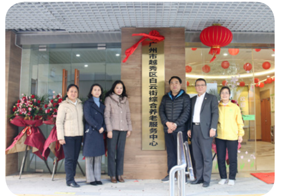
白云街综合养老服务中心（颐康中心）揭牌