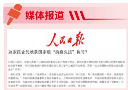
《人民日报》报道截图