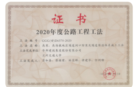
全国公路工程工法证书 （华邦建设现拥有国家级工法 3 项，省部级以上工法 14 项）

作为国家科学技术进步一等奖获得者，华邦建设拥有甘肃省企业技术中心，拥有国家级高新技术企业，实用新型专利 26 项，发明专利 7 项，软件著作权 2 项。自成立以来，企业高度重视建设工程新技术的研发和应用，持续加大科研投入，组织专业团队实施技术创新和科技攻关，形成一系列企业特有的工法、技术、专利成果。