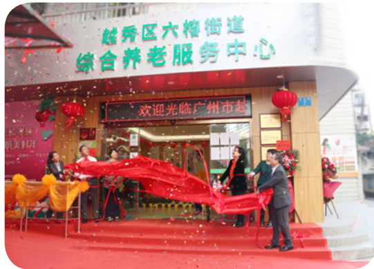
六榕街综合养老服务中心（颐康中心）揭牌

综合养老服务中心。两家颐康中心的投入使用对越秀区完善社会养老服务体系，构建具有广州特色的“大城市大养老”模式具有重要意义。